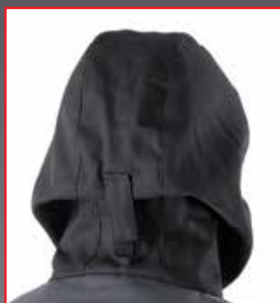
Système de réglage au dos de la capuche.

Une longueur dos de 121 cm assurant une protection optimale de l'opérateur jusqu'aux genoux.