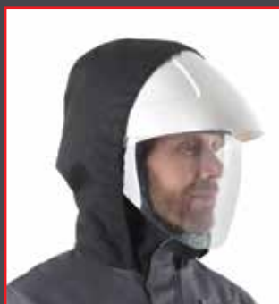
Capuche avec casque.

Une capuche ajustable pour mieux protéger la tête et la nuque en cas de risque élevé, à porter avec une visière ou un casque.